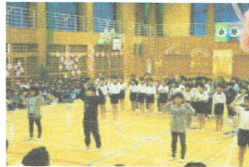
4年生からは応援のエールが送られました。