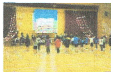
3年生は「語り」を披露しました