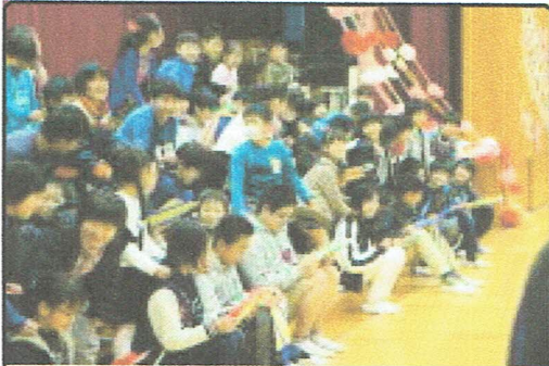
下級生からプレゼントされた色紙を眺めながら1年生に肩をたたいてもらう6年生

あこがれだった6年生の素晴らしい姿を三小の伝統として受け継いでいこうという下級生の気持ちとこれからの学校を任せるよ、という6年生の期待が通じた心温まる集会となりました。