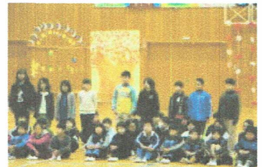
会を進行した5年生。すてきな会場と堂々とした態度でした。