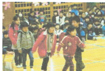
朝の登校での優しさを劇で表現した2年生