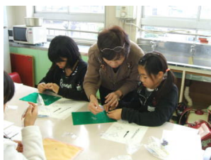
【 ビーズ 】