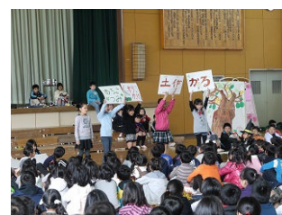
3年「ゆかいなまほうつかい」