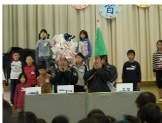
5年「君をのせて～環境学習のとりくみ～」