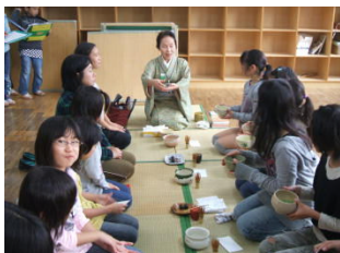
【 茶道 】