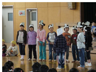
1年「おむすびころりん」