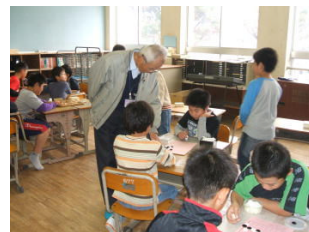
【 囲碁将棋 】