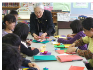
【 折り紙 】